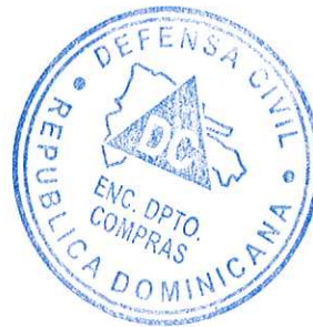
Melbin Rondon Brño Compras D.C.

Observaciones: (Indicar Observaciones, si las hay)